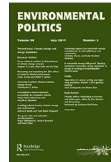
Avrami L. and Sprinz D. (2018) ‘Mesurer et expliquer l’effet de l’UE sur les performances climatiques nationales’ [en anglais]