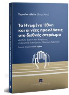
Zervaki A. (2018) ‘Culture et durabilité: un autre défi pour l’ONU’ [en grec]