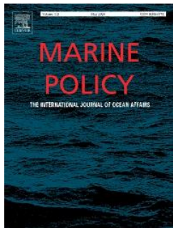
Zervaki A. (2018) ‘Sécurité humaine et atténuation du changement climatique: le cas de la gouvernance des océans’ [en anglais]