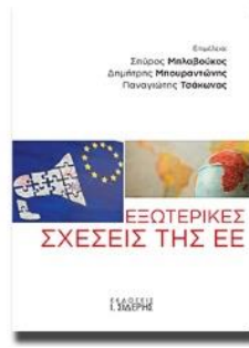
Doussis E. (2020) ‘L’action environnementale extérieure de l’UE et l’exemple du changement climatique’ [en grec]