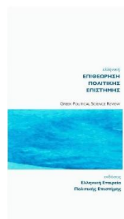
Avrami L. (2019) ‘Dimensions sociales de la politique sur le changement climatique en Grèce en temps de crise’ [en grec] FREE ACCESS