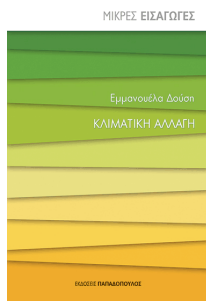
Doussis E. (2017) Changement climatique Papadopoulou Publications [en grec]