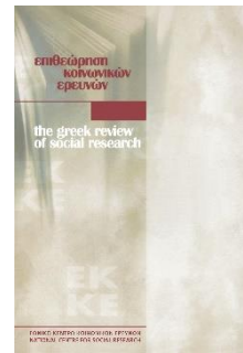
Avrami L. (2019) ‘Les inégalités socio-économiques et environnementales entre les régions des pays européens en période de crise économique’ [en grec] FREE ACCESS